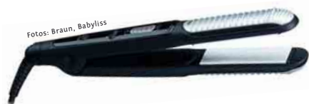
Braun hat den „Satin Hair 5 Multistyle“ neu ins Sortiment gebracht

glätter „Flexa“ (UVP: ab 69,90 €) mit gleitenden Platten, die einen perfekten Kontakt auf dem Haar und somit eine gleichmäßige Wärmeverteilung über die gesamte Länge des Haares garantieren. Als „Floating Plates System“ wird diese Technik bezeichnet. Die Platten besitzen eine Keramikoberfläche mit Turmalin, die das Haar schont. Mit dem „Ceramic Heat System“ erreichen sie die maximale Betriebstemperatur von 230° C in nur 30 Sekunden und halten die Temperatur dann konstant. Mit dem Gerät ist es möglich,