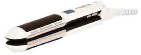
Der Rowenta-Haarglätter „Liss&Curl“, der auch Geschenkband-Locken erzeugt