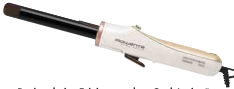
Rotiert beim Frisieren – der „Curl Active“ von Rowenta