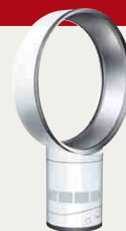
links: der „Air Multiplier“

Der neue „Air Multiplier“-Ventilator von Dyson hat den „red dot product design award 2010: best of the best“ erhalten. Der Bodenstaubsauger „DC26 Allergy“ des britischen Herstellers wurde mit dem renommierten „red dot award“ in Bereich product design ausgezeichnet.