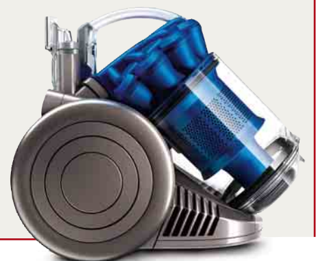
unten: der „DC26 Allergy“ von Dyson