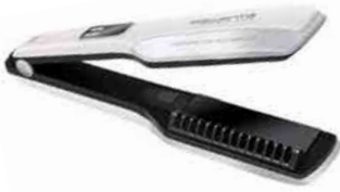
Rowentas Haarglätter „Double Liss“ ermöglicht zwei simultane Anwendungen