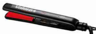
Gleitende Platten sorgen beim Glätten „Flexa“ von Valera für eine gleichbleibende Wärme

mit Nano Titanium-Keramik beschichtet und dadurch besonders glatt und haarschonend.