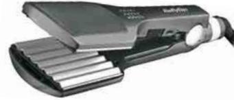
Mit extra großen Krepp-Platten ist der „pro crimp“ von Babyliss ausgestattet