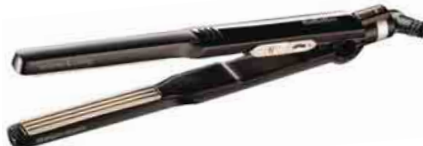
Das Kreppisen „volume & mini crimp“ von Babyliss sorgt für Trendfrisuren