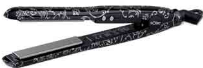
Nur 17 cm lang ist der Pro Mini Styler von Solac