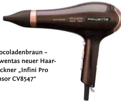
Chocoladenbraun – Rowentas neuer Haartrockner „Infini Pro Sensor CV8547“

glätter „Double Liss SF 7225“ (UVP: 79,99 €). Um bei ihm die Effizienz der nur 2,5 cm breiten Glättplatten zu erhöhen, entspannt und erwärmt ein heißer Kamm vorher die Haare. Bis 230 °C in fünf Stufen kann seine Temperatur eingestellt werden. Eine LED-Anzeige informiert über die Gradzahl. In nur 30 Sekunden heizt das Gerät auf.